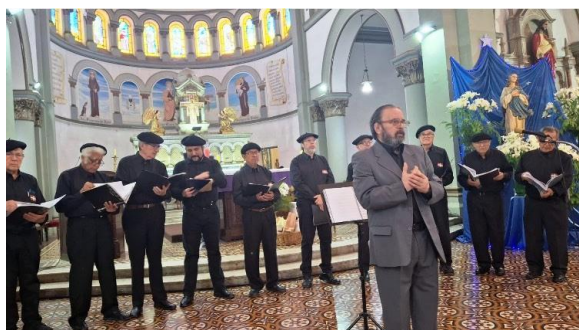
El Coro también cantó canciones populares vascas.