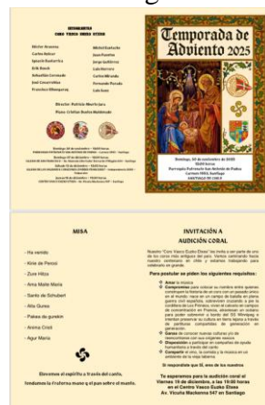
Afiche en la Iglesia.