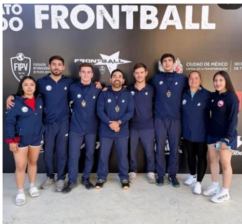
Nuestros seleccionados junto a sus entrenadores.