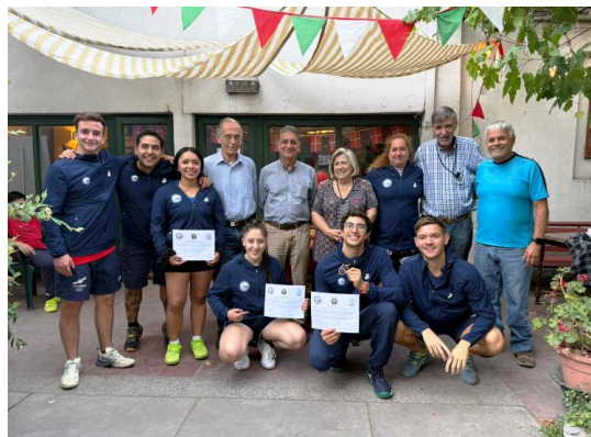
Los Directores de Euzko Etxea, junto a los seleccionados chilenos.