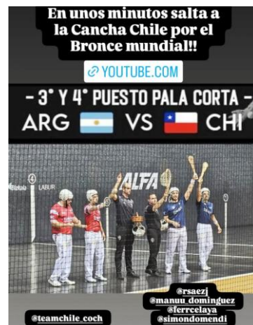
Muy buen cuarto lugar.