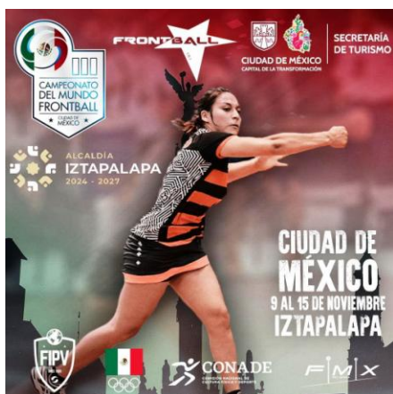
Afiche del Mundial de Frontball.