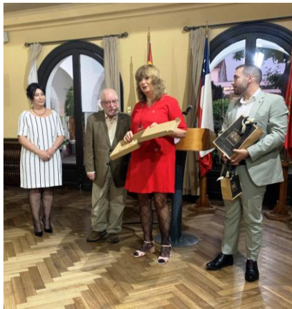
Intercambio de regalos con la Colectividad Navarra de Chile.